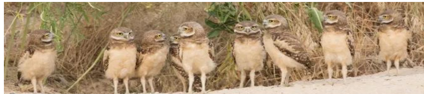
Búhos de Madriguera juveniles.

Recuerda, plantas y animales en la naturaleza dependen unos de otros para sobrevivir. Esto quiere decir que algunas veces los Búhos de Madriguera comen animales y otras veces se convierten en comida para otros para brindar energía. Así es como un ecosistema funciona. Como humanos, formamos parte del ecosistema también. En lugar de destruirlo, podemos apoyarlo y mantenerlo saludable.