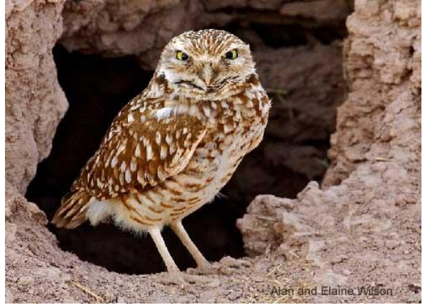
Adult Burrowing Owl